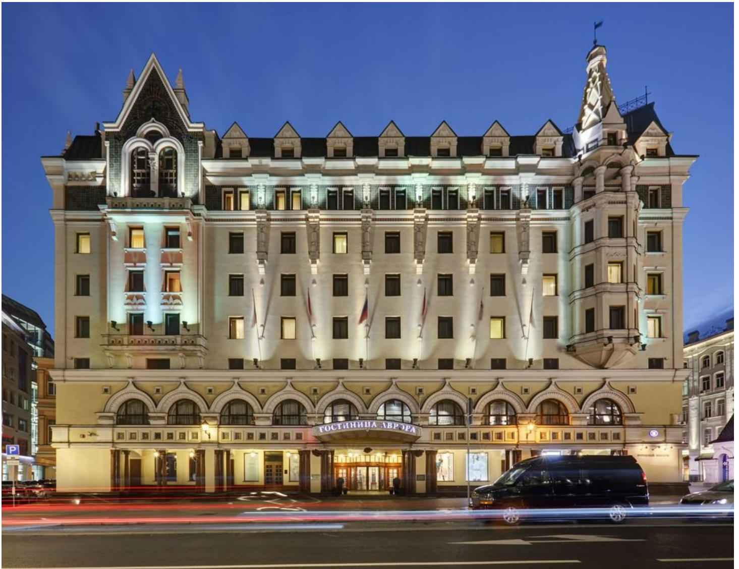
Рисунок 2. Внешний вид гостиницы

Полное название гостиницы: «Moscow Marriott® Royal Aurora Hotel». Сокращенное наименование: «Moscow Marriott Royal Aurora, гостиница».